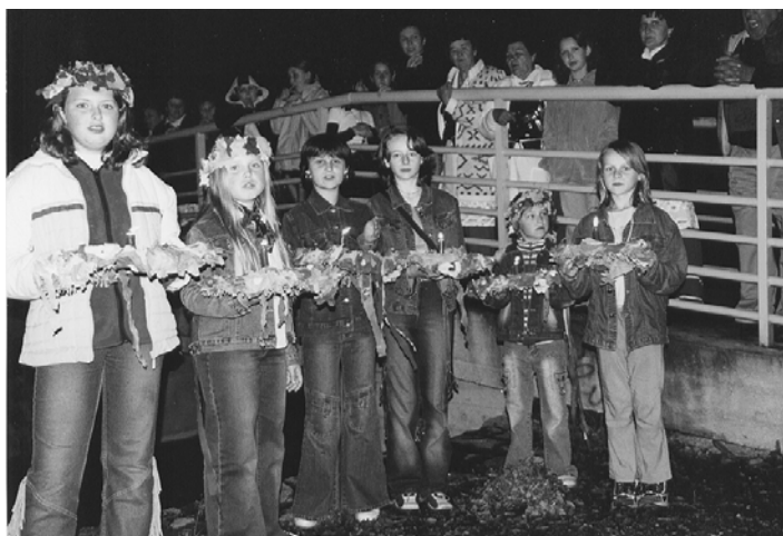
Wianki - nieodłączna część imprezy