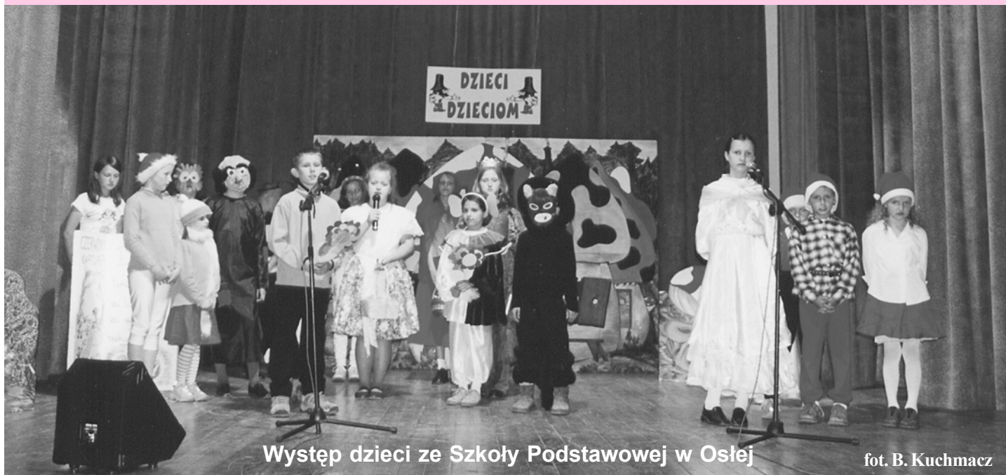
Występ dzieci ze Szkoły Podstawowej w Osłej