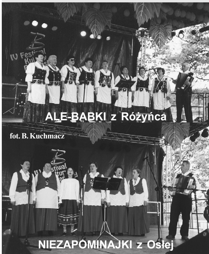
ALĘ-BABKI z Różyńca