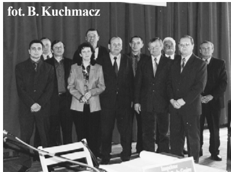
Radni na XX sesji

7.06.2004 r. wydatkowanie dotacji z krajowego systemu ratownictwa gaśniczego na działalność jednostek OSP w Różyńcu i Gromadce. Członkowie Komisji mieli wgląd do dokumentacji, tj. faktur na zakup sprzętu oraz księgi inwentarzowej Gromadki. Po wysłuchaniu informacji prezesów jednostek w sprawie pozyskania i wydatkowania środków w 2003 roku Komisja stwierdziła, że środki finansowe są przeznaczane wyłącznie na działalność statutową. Ponadto wniosowała o ubezpieczenie remiz strażackich przed kradzieżą, w związku z włamaniem do obiektu w Różyńcu.